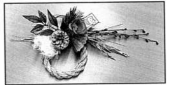
▲「しめ縄飾り」 大好評企画が待望の復活!

利用者のみなさんには昨年度に引き続き、感染予防に協力をいただき、開館することができました。ひろば内やおもちゃの消毒も引き続き行っています。 ・プログラムが実施できない期間(1/21~3/21)は、季節を感じてもらえる工作を企画。「ひろばに来るきっかけになった」「工作ができて嬉しい」と好評でした。 ・「5分で作れる簡単おもちゃ」(7月・9月)「オムツ交換BOX」(9~10月)「祝日開館」(1・2・3月)など、新しいプログラムが実施でき、日常のひろばが戻りつつあると感じました。 ・毎年恒例の「感謝デー」(11月)には、マンションのエントランス前に地域の方や親子が並んで待っていて、みなさんが楽しみにしてくれていることが伝わってきました。