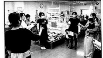
▲「感謝デー」 大型おもちゃのじゃんけん大会