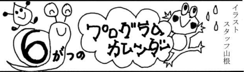
イラスト スタッフ 山根