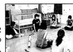
体験談を熱心に聞くママたち

2ヶ月から2歳の親子5組が参加し、はじめに2名の保育・教育コンシェルジュさんから入園までの流れなどのお話がありました。また、「フルタイムの仕事でも幼稚園に通園は可能?」「認可と認可外保育所の違いは?」などの事前質問にも丁寧に答えてくれました。保育園、幼稚園の先輩ママの体験談では「保育園は家からの距離がポイントに。荷物も多いので家に近いとストレスがなくなります。」「給食のアレルギー対応は園によって違いがあるので、事前確認した方がよいと思います。」など話してくれました。参加者からは「先輩ママの声を聞いて、質問もできてよかった。」との感想があり、実際に話を聞いた満足感が伝わってきました。