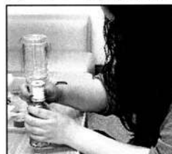
▲うまく接続できたかな!

まずは、ビーズを選んで、食紅で作った色水で好きな色を作ります。お子さんの好きな色になるように色水の濃さを調整する姿は真剣、まるで実験中のようです。そして接続部分のホースにビニールテープを巻いて2本のペットボトルを繋げます。水漏れが無いようにピタッと巻くところが難しく、毎回皆さん苦戦します。最後に防水テープと仕上げのビニールテープを巻いて、オレンジ、ブドウ、メロン、ラムネ、色とりどりのジュースみたいなペットボトルウォーターの完成です!