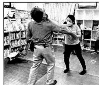
▲護身術、実践中のスタッフ

通報してから警察官が到着するまでは平均10分。不審者の中へ入れないように必死に対応したスタッフたちは「10分って長い～」と口をそろえて言っていました。訓練の後は、すぐに使える護身術を習いました。