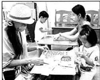
▲どのシールを貼ろうかな

7/5~7/11まで、利用者の方にも事前準備にご協力いただき、牛乳パックヨーヨーにペンやシールで自由に飾り付けをしてもらいました。また、6月末からはうちわ工作にすいかやひまわりなどの折り紙を折ってもらいました。みなさん楽しみながら作ってくれて、ちびっこえんにち当日はかわいらしい手作りヨーヨーがたくさん並びました。スタッフ手作りの提灯もひろばを飾り、当日までのワクワク気分をみんなで楽しむことができました。