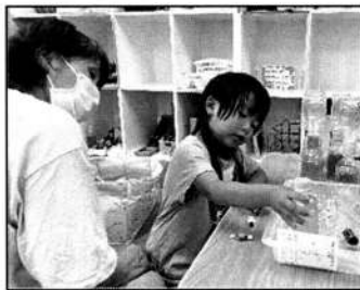
▲おばあちゃんと一緒に!

0歳から4歳児の6組の親子の参加で開催しました。赤ちゃんから少し大きくなったお子さんまで皆が大好きな、ひろばで人気の手作りおもちゃ。「家でも遊びたい」の声にこたえて、毎年開催の人気のプログラムです。