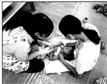
▲普段のはみがきチェック中!

参加した方からは、「他の方の疑問やお話を聞けよかった」「ずっと不安に思っていたことが解消されてよかった」などの感想があり、満足度の高さがうかがえました。