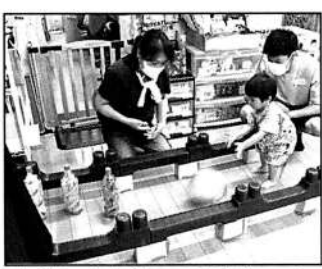
▲ピンをねらって「えいっ!」

今回は的あて、牛乳パックヨーヨー作り、うちわ工作、ボウリングの4つのコーナーを用意。ヨーヨー作りは小さいお子さんがパパと一緒に頑張って釣りあげたり