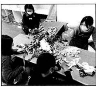
▲おしゃべりも楽しい!!

4組の参加でした。色とりどりのはぎれの山から好きな布を選んで、ひたすら結んでいくというクラフト。最後に長さを整えるためどんなふうになるのかドキドキです。選ぶ色や結び順で全く雰囲気異なる作品が出来上がりました。