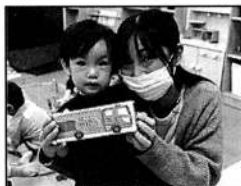
▲これで家でも遊べる!

たくさんの寄付をありがとうございました。収益96,190円はひろばの運営費として大切にに使わせていただきます。