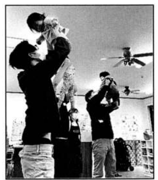
▲「高い高い」で最高の笑顔!

からだを使って楽しんだ後は、「パパのぶっちゃけ本音トーク」のテーマでラベルワークの時間です。「毎朝ご飯を作っています」「ドラム式洗濯機は便利ですよ!」「平日は時間が取れないので、土日にママのための時間を作っています」等、育児にも家事にも積極的に関わっている様子が伝わってきました。講師おすすめの休日の過ごし方の1つが「場所はどこでもよいのでお友達家族とおでかけをする」でした。大人の手もたくさんあり、子どもたちも楽しめるというメリットがあるとのことでした。