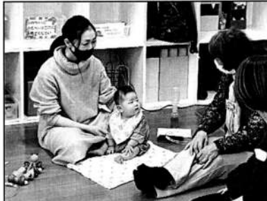
▲終了後も質問は尽きません

「断乳の際、大泣きするという事はまだやめたくないという事。可能であれば続けてあげるといいですね」「保育園でミルクを拒否するお子さんには無理強いせず、帰ってから母乳を飲ませてあげて下さい」など、お子さんの気持ちに寄り添う大切さのお話もありました。助産師さんにより意見が異なり悩んでいる方には「ママがどちらの方法が負担にならないか選んでみるといい」と優しく寄り添う場面もありました。