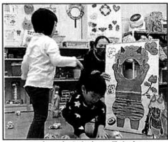
▲オニさんとおせるかな?

2/1と2/2は、ひろぼに来た親子に豆まきも楽しんでもらいたい、とサプライズ豆まきを実施。オニのイラストを貼ったペットボトルやオニの顔出し撮影パネルめがけて、チラシで作った大きな豆を投げます。ノリノリで豆を投げる子や、初めてのオニに少し泣いてしまう子もいましたが、「家でなかなかできないからよかった」と感想があり、ひろぼならではの豆まきを楽しんでもらえたようでした。