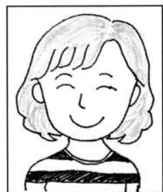
(イラスト 吉野純子さん)

桜前線が気になる季節になりました。毎年お弁当を作り、近所の公園でお花見をしています。◆満開予想と天気予報を見て、花見をいつにするか・・・今年は孫も一緒に賑やかなお花見ができるといいな。◆昨年からピアノ教室に通い始めました。レッスンでは、指が動かない・・・なんてこともよくありますが、脳の活性化と、好きな曲を弾く楽しみのために、これからも長く続けていきたいです。