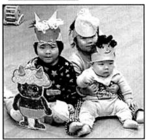
▲お面をつけてみんなでパチリ

今年は丸く切った色画用紙につの毛糸の髪の毛を貼って顔を描く、オニの壁面工作を企画。スタッフが飾りとして用意した折り紙の恵方巻と梅の花も好評で、恵方巻を食べているようなかわいいオニもできました。お子さんが顔を描けることに感動して、ずっと動画を撮っていたママも。また、何度も作ってくれたお子さんは、作り方を覚えて「こうやるんだよ」と逆にスタッフに教えてくれるように。お子さんたちの成長の過程が見られてこちらもうれしくなりました。カラフルなおニはバンドをつけてお面にもなるので、頭につけたままうれしそうに遊ぶお子さんもいました。