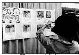
▲覗いてみよう! 園児のお弁当♪

「バスと歩きどっちがいいの?」「給食とお弁当、それぞれのメリットは?」「どんな行事があるの?」「面接料は?」など様々な質問が出ました。今回、初の試みとして先輩ママ協力のもと「園児のお弁当」の写真を掲示しました。携帯で写真を撮る方、工夫した点などを熱心に聞く方など、皆さんの参考になったようです。「気になることが聞けてすっきり!」「先輩ママの話が参考になった。」「皆さんの質問を聞いているうちに、聞きたいことがたくさん出てきた。」などの感想があり、いくつかの観点を参加者全員で考えることで、自分に必要なポイントが見えてきたようでした。