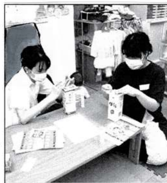
▲真剣に作業するママたち

「ずっと欲しかったので手に入るとてもうれしい」「テープ貼りが難しかったけど仕上がりはきれいにできたので満足」との感想が聞かれました。ぜひおうちでもたくさん遊んでくださいね。