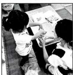
▲ギョツ、ギョツ 牛乳パックに紙詰め作業中! しんでもらえました。

キッズタイムで久しぶりに親子工作を参加5組で実施しました。ママと一緒にさみを使ったり、弟のために一生懸命作っているお子さんなどそれぞれの年齢でできることに挑戦している姿が微笑ましかったです。