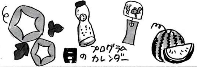
イラスト スタッフ山根