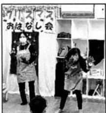
▲スタッフもバリバリ

ハンドベルとトイピアノの「もろびとこぞりて」でひろばは一気にクリスマスの雰囲気。絵本「はらぺこサンタのクリスマス」はBGMにトイピアノが入り、みんなで手拍子をしてサンタさんを応援。手遊びの「もみの木」では、もみの木の手袋をつけて歌い始めると身体をゆらして楽しんでくれるお子さんたち。スタッフオリジナルのパネルシアターでは、みんなで手をたたくと、あら不思議!白黒だったおもちゃはカラフルに!ハンドベルやトイピアノ、歌と手拍子でみんなにこここ笑顔になりました。