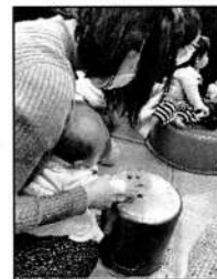
▲ママといっしょにトントン 足な40分。

開始前から今成先生がタライを太鼓にリズムを叩き、良い雰囲気なかイベントがスタート。前半の30分は並べられた段ボール、お菓子の缶やお鍋、フライパンなどをハンドタオルを巻いたラップの芯で叩き色々な音とリズムを楽しみました。手を添えてもらって叩く子、自分でどんどん叩きに行く子、みんなとっても楽しそうでした。5ヶ月のお子さんはママが色々な音を聴かせてあげていました。