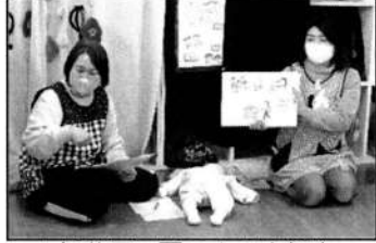
▲紙芝居で園の1日を紹介

初めて体験した方がほとんどでしたが、再生のデモンストレーションをしてくれた方ははっきりとした声での録音は良いお手本になりました。 「落ち着いて対応できるかな」「新しいことが知れ、備えるきっかけになった」などの感想がありました。