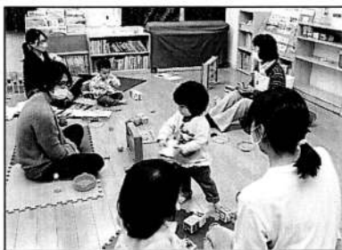
▲講座の間も「ママあそぼうよ!」

きょうだい育児中の方が2組、下のお子さんを妊娠中の方が1組の参加で開催。まずは参加者みんなの悩みや不安を聞きました。「同時に泣いてしまった時どちらを優先するか、一人でもイライラするのに二人子育ての想像がつかない」助産師・渡邊さんからは「きょうだいの子育ては『上のお子さんを優先』が基本です」というお話が。「下のお子さんはお腹にいる時から、ずっと兄弟がいる生活リズムで過ごしています。それでも上のお子さんの要求をすべて応えることは難しい。できない理由を言葉で伝えましょう」講座ではお風呂に入れる順番やパパの手助けの必要性など、話題が尽きませんでした。 参加者からは「上の子下の子それぞれの欲求に応じて心を満たしたい」「二人育児のイメージがわかりました」と感想があり、ママの心が少し軽くなったようでした。