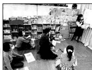
▲情報交換、皆さん真剣です!

初めて体験した方がほとんどでしたが、再生のデモンストレーションをしてくれた方ははっきりとした声での録音は良いお手本になりました。 「落ち着いて対応できるかな」「新しいことが知れ、備えるきっかけになった」などの感想がありました。