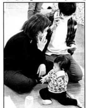
▲皆で171体験実施中! しくて15日に合わせての開催でした。

0歳児と1歳児の親子5組と泉区の「ピッコロひろば」のスタッフさんの合計12名での開催でした。自己紹介の際に12年前の東日本大震災のことを振り返りました。