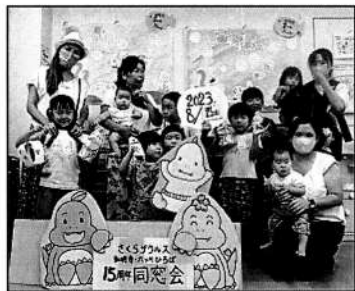
▲めいっばい遊んで時間がなく なり慌ててパチリ(2日目)

▲「久しぶりの手形！」 と楽しむ中学生 中高生達は幼少期に読んでもらった絵 本を懐かしそうに読み返していたり、「幼稚園以来！」とイン クの感触に戸惑いながら手形アートに参加していました。真剣 に牛乳パック工作をする姿も微笑ましかったです。小学生もお もちやが小さく見えました。「保育園の掲示を見てきました！」 と土曜日に親子での来所も。