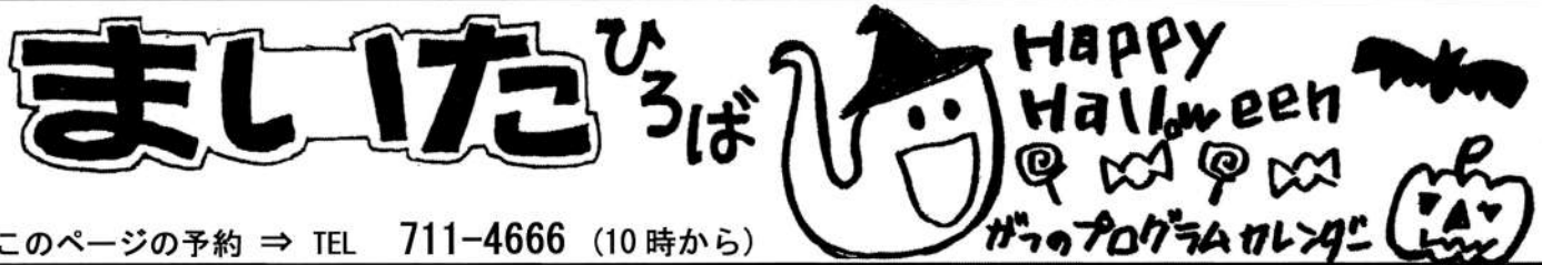
イラスト スタッフ 山根